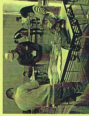
今年度の「市民提案事業」事業の様子「明智光秀ゆかりの地」と「中世の山城跡」で地域おこし 事業