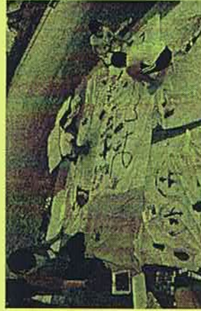
今年度の「初めの一歩助成」事業の様子「あそびの達人と遊ぼう！」事業